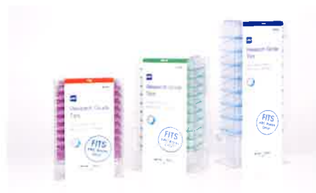
リサーチグレード 詰め替えチップ