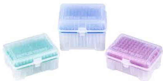
リサーチグレード ラック入りチップ