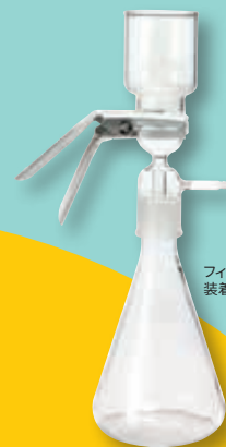
フィルターホルダー 装着時のイメージです