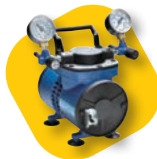
吸引加圧両用 Chemical Duty ポンプ