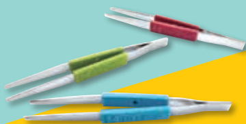
ステンレス製フィルターピンセット