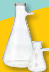
吸引フラスコ (1 L / 2 L)