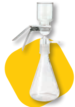
すりガラス接続フラスコ